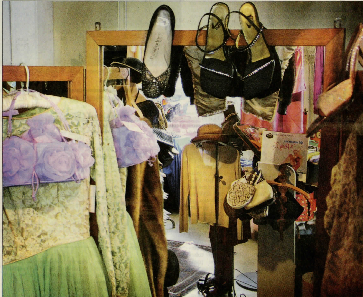
Play it again, Sam myy vanhan ajan muotia.

Muotitietoinen liikkeenomistajatar vaihtaa putiikkinsa vaatevalikoimaa hetken trendien mukaan. Koska Play it again, Samin varastoista löytyy vaatteita aina 1800-luvun lopulta